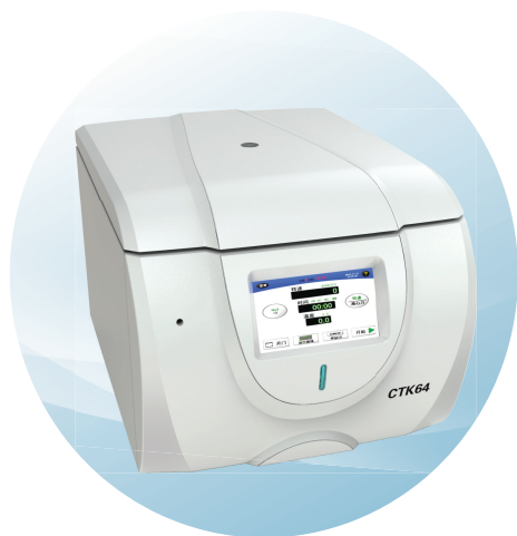
CTK64低速台式常温（自动脱盖）