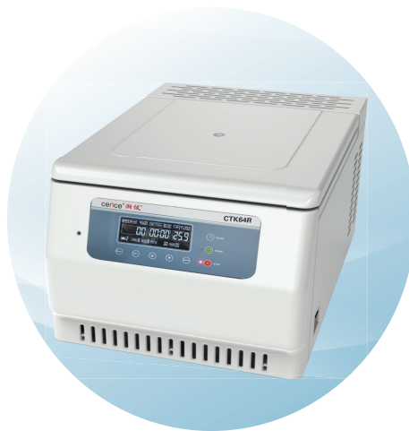
CTK64R低速台式冷冻（自动脱盖）